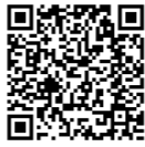
ホームページはこちら

長野銀行の個人向けインターネットバンキングは、12月30日（火）21時にサービスを終了いたします。 合併後もインターネットバンキングのご利用をご希望される場合は、お早めに「八十二インターネットバンキング」のご契約をお願いいたします。 詳細はホームページにてご確認をお願いいたします。